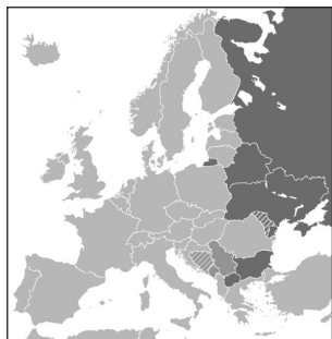
Рис. 2. Взгляд на карту пользователей кириллицы раскрывает геополитическую функцию Румынии – разделение сербов и русских, а затем окружение и уничтожение сначала сербов, а потом и русских.

Интерес представляют свидетельства французского ученого Якова Бонгарского, который в 1585 году путешествовал через Валахию в Царьград и оставил запись, что ему паспорт в Бухаресте выдан на сербском языке, чтобы он мог переехать через Дунай, а также добавил наблюдение, что в то время жители Валахии пользовались «сербскими буквами и сербским языком» (10).